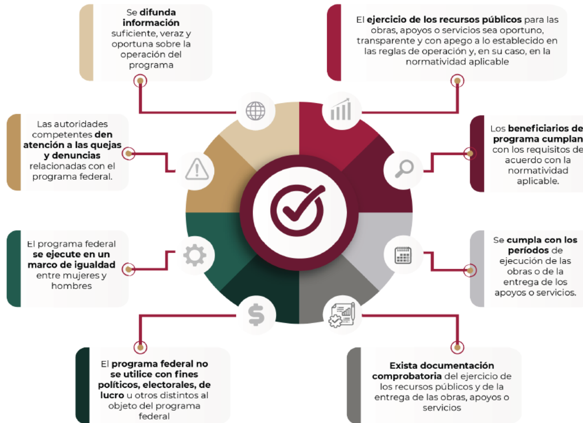
Gráfico 4. Resumen de atribuciones vigilancia de la Operación Elaboración propia CTA.