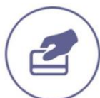
Pago de Derechos