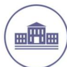
Organismos Auxiliares Declaraciones